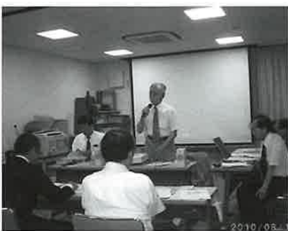
丁寧な説明をいただきました

『とんとん館』では、子育て支援・手作り小物・木工作品・竹細工・わら製品などの製作が行われている