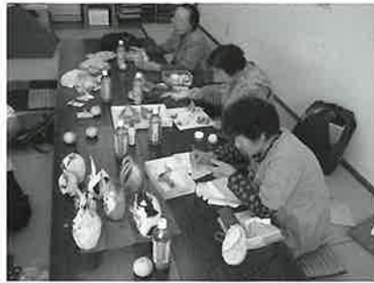
手芸同好会の活動の様子

今年度に入り『手芸同好会』と『シルバーパットゴルフ同好会』の二団体が発足し、メンバーが集まり、定期的に活動をしています。