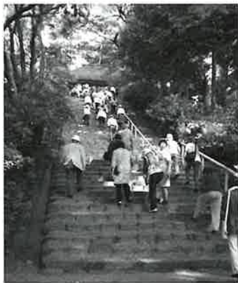
長い階段も元気よく

二日目は、雨も上がり少し暑い位の天候となりました。室生寺では、五重塔まで二百五十段、さらに奥の院まで五百段と二十〜三十名の会員さんが登られました。とてもシルバー会員とは思えない健脚ぶりでした。