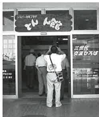
店舗を利用した『とんとん館』