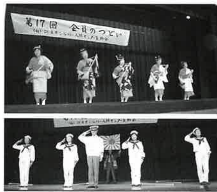
スペシャルゲスト登場!?

午前の部は、市民ボランティアグループ『おらっちゃん劇団』による寸劇が行われ、交通事故の防止をテーマにしたコントや、歌や踊り等の楽しいお芝居を観覧しました。