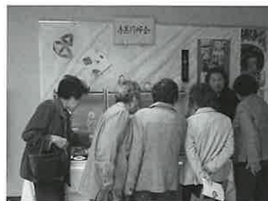
手芸部同好会の展示コーナー

そして今回新たな試みとして、こうした会員の方や手芸同好会手作りの作品(陶芸作品・帽子・バッグ等々)を販売するコーナーが一階ホワイエに設けられ、皆さん気に入った物があると、気軽に買い求められていました。