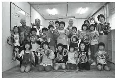
出来上がったリースを持ってチーズ!

と子ども達の感想が聞かれました。この伝承遊び体験学習は今年度、六回実施しました。