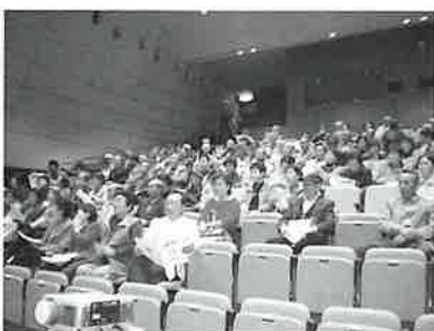
楽しいひと時を過ごしました

この時期、市内ではあちこちで行事が重なり、参加者が例年より下回りましたが、参加された会員さんは、思い思いに楽しいひと時を過ごしました。