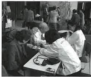
熱心に健康相談する会員の皆さん

まずは受付から開会までの間、その日の体調チェックも兼ねて、看護師さんによる血圧測定・健康相談が行われました。