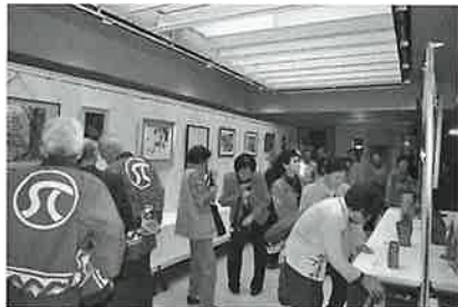
自信作60点を並べた作品展

二階では、会員のつどいのもうひとつの目玉、『趣味の作品展』が開催され、会員の方々の隠れた才能の力作が並び、質の高いそれぞれの作品の前で、見る人々の感動を誘っていました。