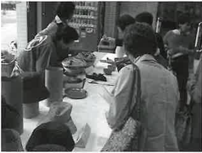
販売コーナーは大盛況でした。

『手芸同好会』では、先日開催された『会員のつどい』で販売ブースを設け、おしゃれな手作り帽子をはじめとした手芸作品を販売しました。