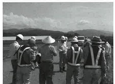
県シ連との合同パトロール

安全・適正就業推進委員会でも毎月一回安全パトロールを実施し、年一回交通安全講習会を開催するなど会員の皆さんに安全就業を呼びかけております。 会員の皆さんにおいても、就業中のヘルメットや安全ベスト、就業途上では車から発見しやすいよう目立つ格好をするなど万全の対策を取られているとは思いますが、今一度、会員・委員が一丸となって目標達成に向け取り組んでいかなければなりません。