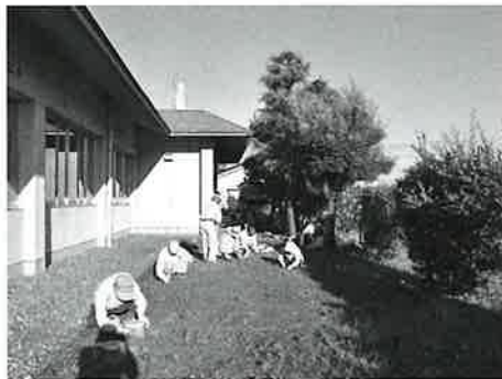
庄東センターでの清掃の様子

参加いただいた会員の皆様のおかげでどちらの施設も見違えるほどきれいになり、利用者・関係者の方々にも大変喜んでいただきました。参加して下さった会員の皆さんご協力ありがとうございました。