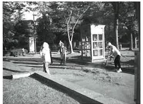
チューリップ公園での清掃の様子

参加いただいた会員の皆様のおかげでどちらの施設も見違えるほどきれいになり、利用者・関係者の方々にも大変喜んでいただきました。参加して下さった会員の皆さんご協力ありがとうございました。