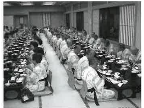
大盛り上がりの宴会

そして伊賀流忍者博物館を見学し、予定より早く皆さん無事に元気で帰路につきました。