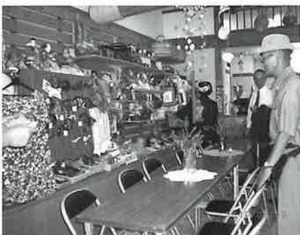
みごとに手作り製品の数々

ほか、週一回、館前にて開催される朝市で、新鮮野菜・米・花などの販売を実施しています。 館内のカーペットが敷いてあるスペースでは、母・子・シルバー会員の三世代が交流し、小学生には、『生き生き学び教室』『子育てはあはと一緒遊びぼう』また、一般の方向けには『ばあばの料理教室』等が開催され、子どもさんをはじめ、地域の方々とシルバー世代の交流を目指して活動されている意欲がとても印象的でした。