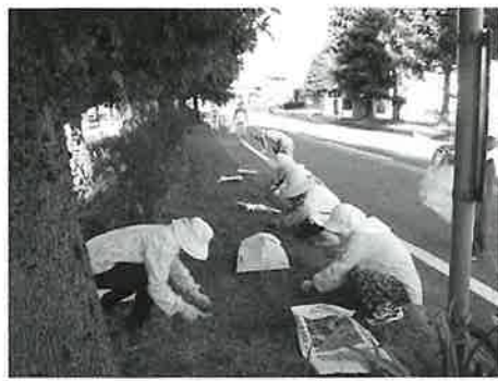
連日の猛暑の中、 がんばっていただきました

八月六日(金)午前六時より、地域社会参加活動の一環として、砺波市シルバー人材センター互助会が中心となり、清掃奉仕活動を実施しました。 今年度は、砺波チューリップ公園や特別養護老人ホームやなせ苑、社会福祉センター(庄東センター)、庄川河川敷の弁財天公園のほか、新たに北部苑を加え、五カ所所で除草・清掃活動を行いました。