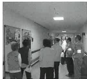
福祉施設での安全パトロール

今年度も安全・適正就業推進委員会を幾度となく開催し、四月には平成二十二年度の重点事故防止目標が協議され、 一、今後もしかなる就業現場でも、安全第一という強い意志を持って就業にあたっていただく。 一、毎回同じ作業を行っている場合の、危険予知の習慣を身につけていただく。 以上のことを会員の皆さんにお願いし、今年度の安全就業推進計画として 『事故全体の対前年比十五%削減』 『会員の健康管理の徹底を図る』 ことを目指し、現在まで取り組んできました。 しかし、平成二十二年十月末現在の事故発生件数は、十七件(うち人身傷害事故七件、物損事故十件)と前年の発生件数十八件に到達する勢いとなっております。