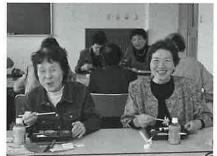
秋の味覚を舌鼓顔も笑顔に

昼食後は、午後の部、映写会。『綾小路きみまろのお笑いライブ』映像が写し出され、個性豊かな毒舌ネタに、日頃の疲れを吹き飛ばすような笑いが場内のあちこちで起こっております。