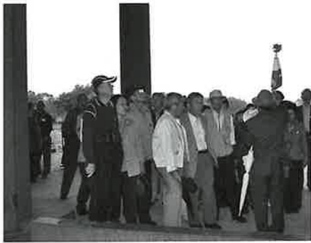
説明に聞き入る会員の皆さん

一日目はバスの中で、途中からあいにくの雨模様でしたが、興福寺を見学、そしてメイン会場世界遺産、平城宮跡(遣唐使船復元展示・朱雀門)奈良時代の平城宮の入口、第一次大極殿(天皇が執務や儀式をおこなう場所等)の説明を現地ボランティアガイドさんから聞きました。