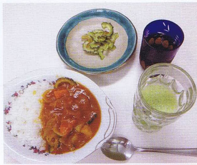
ゴーヤが様々な料理に大変身しました

昼食には、皆さんで作った料理を談笑しながら楽しく味わいました。参加者の皆さんからも ●ゴーヤは苦手だったけど、工夫をすればおいしくなることが学べました。 ●早速作って家族にも振る舞いたい。 ●友人などにもレシピを教えてあげたい。 ●受講は二回目だけど、前回も合わせて料理のレパートリーが増えてうれしい。 などの声が聞かれ大変有意義な教室となりました。(レシピご希望の方は事務局へご一報を)