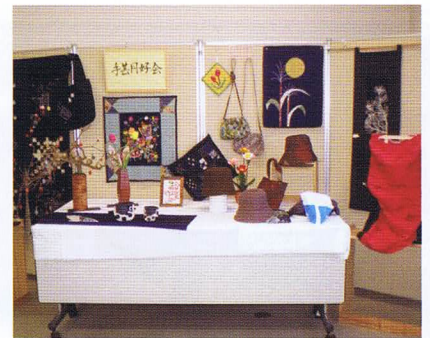
会員のつどいで素晴らしい作品の展示