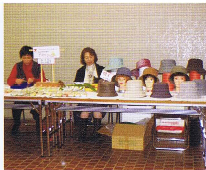
会員のつどいで大好評だった帽子・バック