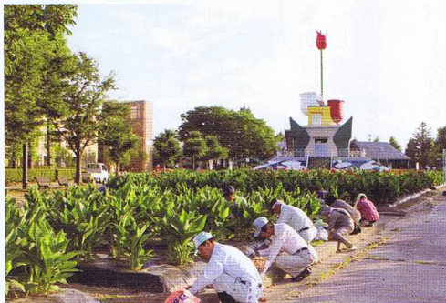
チューリップ公園での清掃の様子