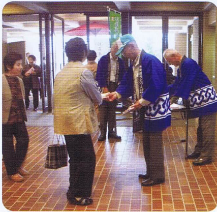
来場された皆さんにパンフレットを配布しました

この「伝承遊び体験」は子育て支援事業の一環として、これまでも小学校のPTA行事や、学童保育の場でも行ってきました。