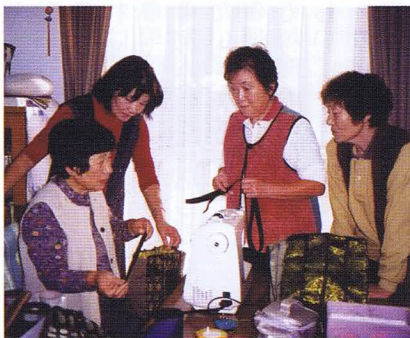
サークル活動の様子皆さん楽しそうですね♪