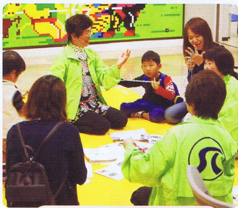
あやとりの様子 子ども達はすぐに上達

そして会場では、会員が生き生きと働いている様子の写真パネルを設置し、役員がパンフレットを配りながら、シルバー事業の内容を説明し、仕事のご依頼の募集と会員の入会をすすめました。