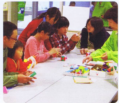
折り紙の様子 親子で一糸懸命作りました